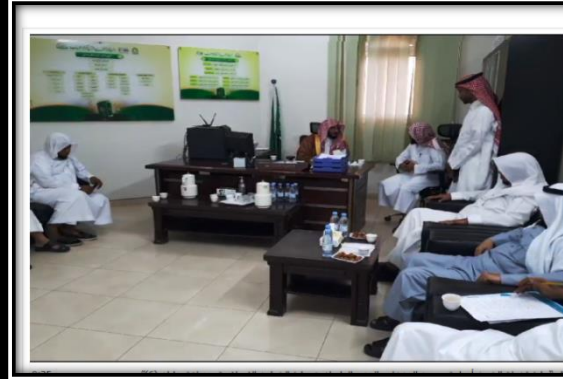
مدير عام فرع الوزارة بجازان في زيارة لمقر الجمعية