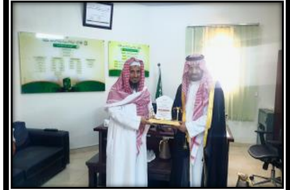
زيارة سعادة محافظ محافظة هروب لمقر الجمعية