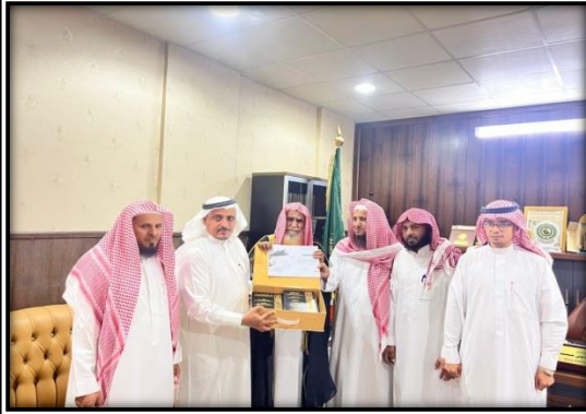
مفوض الافتاء بمنطقة جازان يستقبل أعضاء مجلس الإدارة